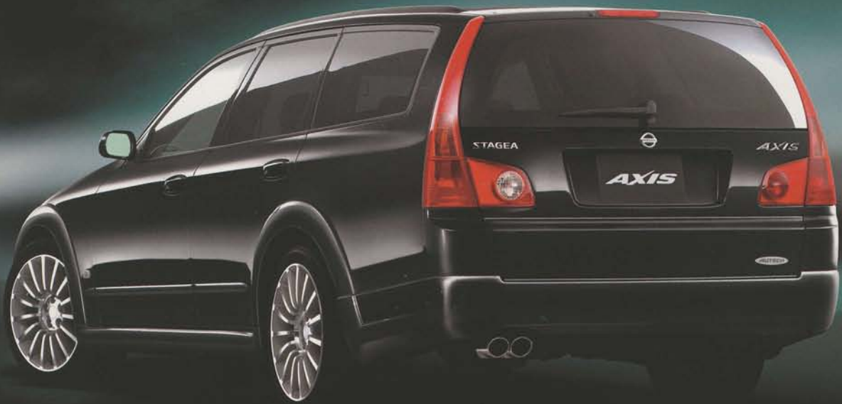
Photo:アクシス 2WD VQ30DD。ボディカラーはスーパーブラック<#KH3>。Sバックはメーカーオプション。 ※アクシスはエアロパーツ装着のため、緑石や段差の大きな場所や不整地路等では路面などと干渉する場合がございます。あらかじめご承知おください。